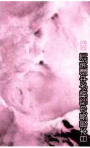
日本最長の温泉中鍾乳洞